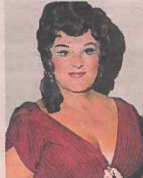
Birgit Nilsson under ett uppträdande på Met Opera i New York 1968.