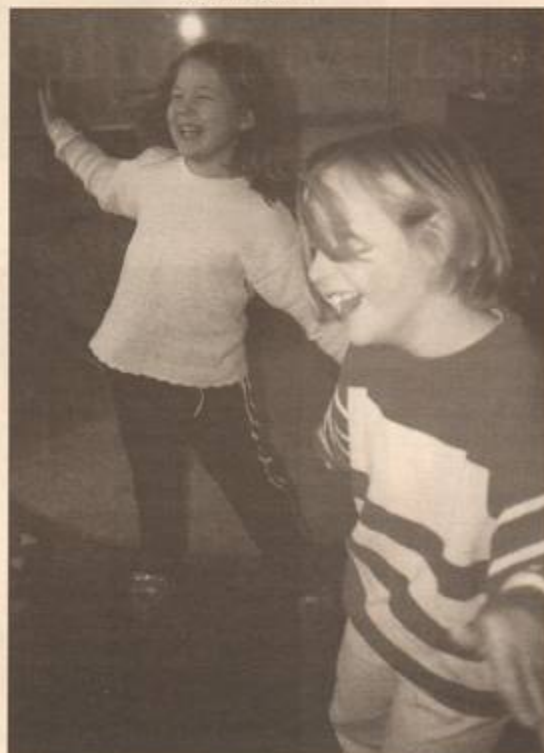
På Hovskolan spelar "fröknarna" musik och barnen dansar loss under en lektion med kompanjonlärarskap. Och visst ser de ut att ha roligt!