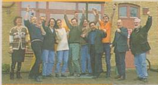
Kulturskolan i Halmstad i glädjepro. - Vi ses på mässan Kultur Forum Fritid 22-24 april, båhar de.

Första priset är 10 entrébiljetter till mässan Kultur Forum Fritid i Älvsjö, till ett värde av 15 000 kronor, Karlstad och Tranås får 5 biljetter vardera. Grattis hälsar redaktionen!