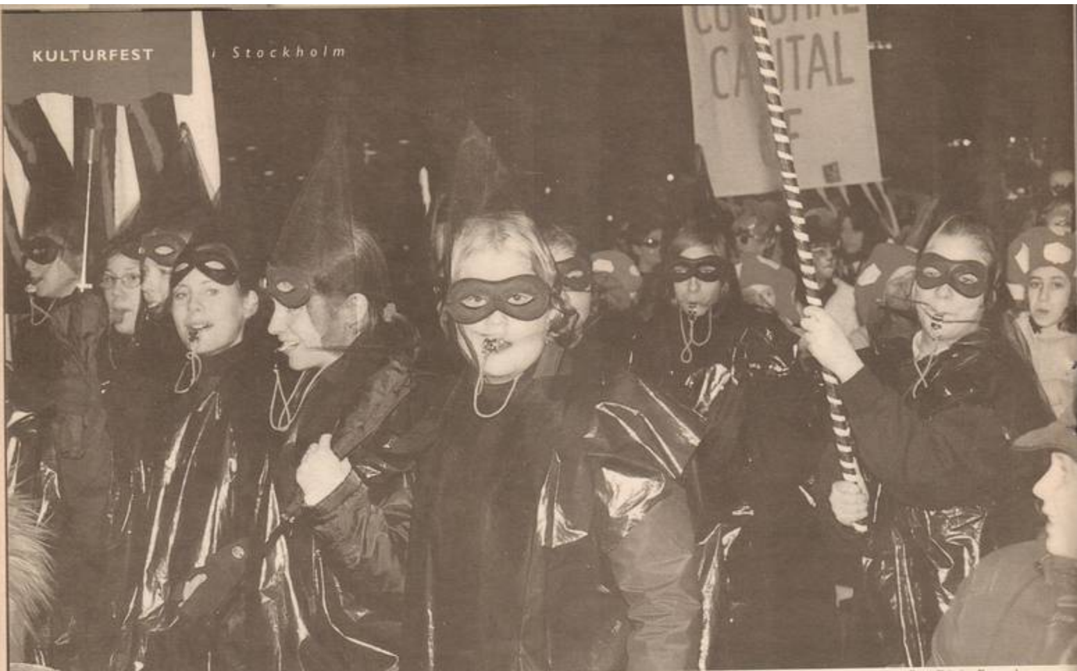
Stockholms kulturskola, Vår teater gav en lysande och färgstark start på barn- och ungdomsdelen av Stockholms Kulturhuvudstadsår. Iförda karnevals-kostymer begav de sig från Kungsträdgården till Sergels Torg för att uppträda för tusentals människor.