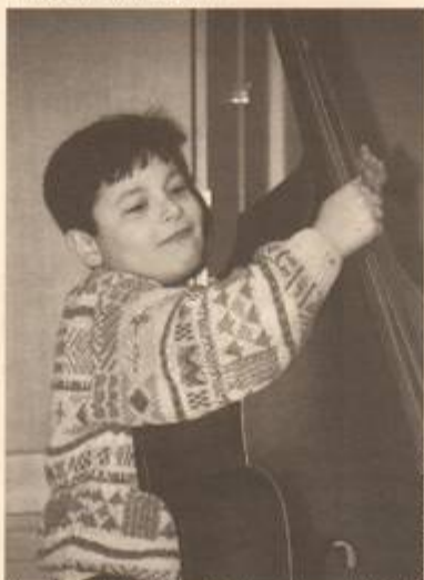
Stockholms kulturskola säljer sina tjänster till Hjulstaskolor och de båda skolorna har ett mångårigt samarbete bakom sig.

Elisabeth berättar med glädje om några av alla de kulturprojekt som skolan genomfört. Bland annat har två vackra konststuffers målats av lägstadiet och högstadiet med inspiration hämtad från kända målare som Van Gogh, Chagall, Picasso med flera. Och en diktbok av skolans elever publicerades för två år sedan.