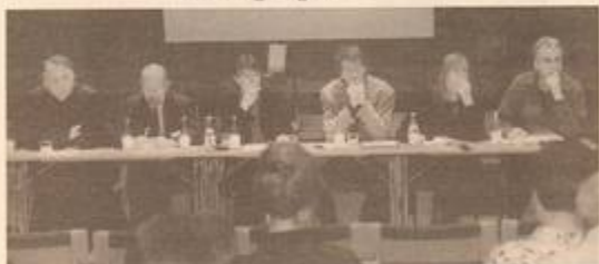
Arbetsgruppen för kultur i skola vid panelen.

Frågan om kultur i skolan har varit uppe vid ett antal tillfällen under tidigare årtionden och resulterat i diverse satsningar och ansträngningar.