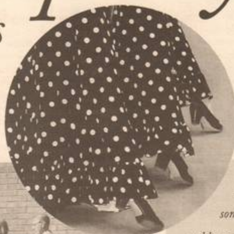
Ett steg i rätt riktning för kultur i skola. Elever från Hjulsta-skolan dansade för konferensdeltagarna.