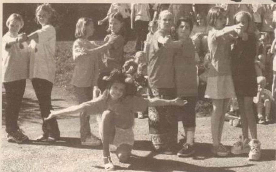
Här övas tango i det vackra vådret!

"Kulturskolan Miranda är ett föredöme för andra musik- och kulturskolor genom sin verksamhet som bygger på mångfald, tradition och nyskapande och genom sin breda förankring hos bygdens invånare. Miranda har med utgångspunkt i personalens och ledningens entusiasm, nytänkande och kunnighet skapat en ny uppåtgående trend för sin skola. Mirandas sätt att entusiastiskt söka och finna nya vägar i arbetet med och för barn och ungdomars möjlighet till skapande verksamhet är lärorikt och intressant för alla musik- och kulturskolor i Sverige."