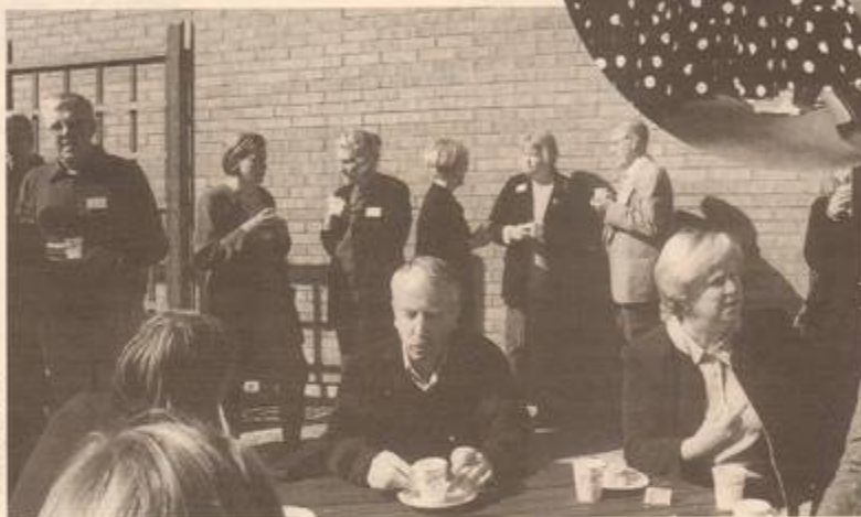
Kaffe-paus i majsolens sken när kulturivare från hela landet kom för att samlas kring idéskriften Kulturens Asplöv.

Det var ingen slump som gjorde att just Piteå valdes som plats för seminariet under två majdagar kring ämnet, kulturens roll i framtidens skola.