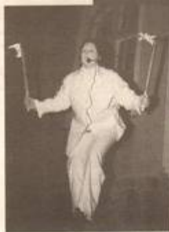
I Tranås kommun invigdes kulturåret under pompa och ståt. Bland annat med eldblåsare och levande statyer.

I Tranås vackraste byggnad, det gamla tingshuset nere vid än i centrala delar av staden, har musikskolan sitt säte. Högborger för kommunens musiklärare och elever.