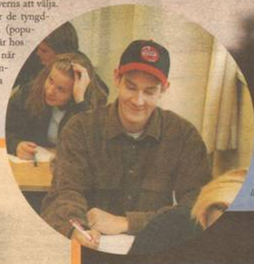
Nöjda minner under Solfègelektionen. Drift i musik- och geöbr-lära alltså.

Skolan förfogar över egna mycket fina lokaler och har dessutom del i en toppmodern och vacker konserthall med 788 platser i Esbo Kulturcentrum. För konsertprogrammet vid Smockans besök stod en av skolans åtta orkestrar. De spelade nordisk musik av Grieg, Rautavaara och Wirén och visade en imponerande bredd genom att fylla på med såväl Hindemith som Mozart och Astor Piazzolla. En konsert som väl sammanfattar den finländska musikstudentens målmedvetna strävan efter konstens högsta ideal.