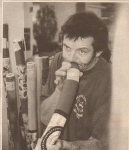
Många stod i kö för att försöka sig på konsten att spela Didgeridoo.

Rekordmånga utställare och musikintresserade besökare möttes under fyra intensiva septemberdagar på musikmässan i Göteborg. En kaskad av seminarier, utställningar, konserter och möten med musik i fokus.