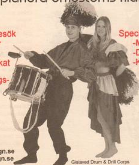
Gislaved Drum & Drill Corps

Sventorpsliden 7 412 74 Göteborg Tel: 031-404030 info@brohalldesign.se www.brohalldesign.se