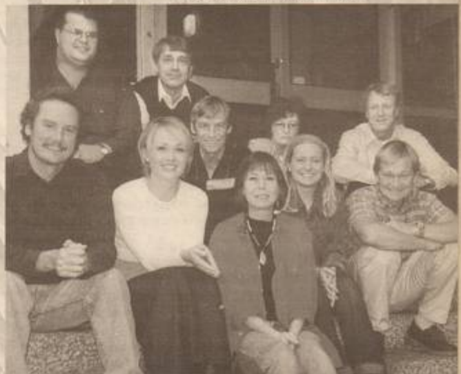
Lärarkåren vid Timrå Kulturskola.