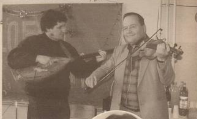
Underhållning vid en byafest med anledning av en skolinvigning i den bosnienserbiska byn Sockovak.