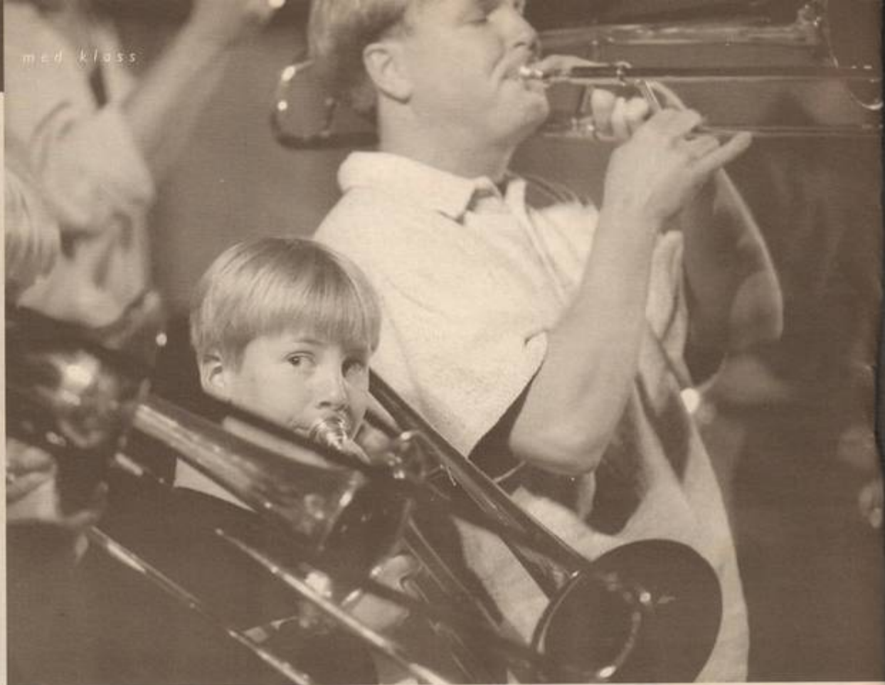
Brassbandet Messing Around saknar motsvarighet i Sverige. Med hjälp av workshops får deltagarna en dag med geörsöspel, ensembleöspel och improvisation.