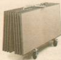
Flytt och förvaringsvagn

Fasta ben – ställbara höjder – inga verktyg – inga lösa delar.