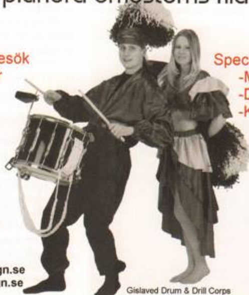
Gislaved Drum & Drill Corps

Sventorpsliden 7 412 74 Göteborg Tel:031-404030 info@brohalldesign.se www.brohalldesign.se