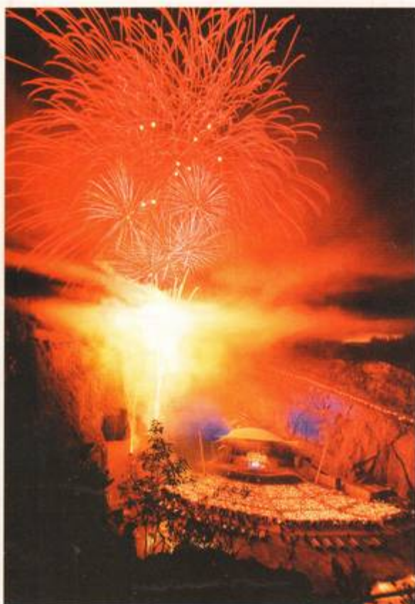
Dalhalla, det nedlagda kalkbrottet i Dalarna, har varit spektakulär konsertscen i över tio år. Med spin-off-effekter som hotell, affärer, restauranger och mycket annat i hela Siljansbygden.

Kulturförvaltningar ska domineras av eldsjälar – inte av byråkrater. Och kultursatsningar ska göras utifrån konstnärliga ursprungsmotiv – inte ekonomiska. Med fantasirika kulturpolitiker och med rätt satsningar kan både små och stora orter skapa ett spännande kulturliv som ger gynnsamma effekter för samhället i övrigt.