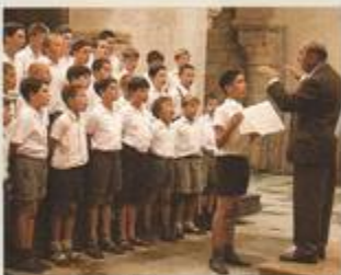
Gosskören - fransk succéfilm

Den så hårt kritiserade talangjakten Idol 2004 återkommer till hösten. En stor publik tittade på, skrattade åt eller förfasade sig över förra seriens många falsksjungande deltagare. Men inte minst fick den stundom okänsliga juryn många känslor att svalla för sitt bryska sätt att döma ut ungdomarna. Ambitionerna för den nya omgången är att hålla sig till samma upplägg vad gäller juryarbetet och programledare. Nya deltagare ska rekryteras via auditioner landet runt. (DN)