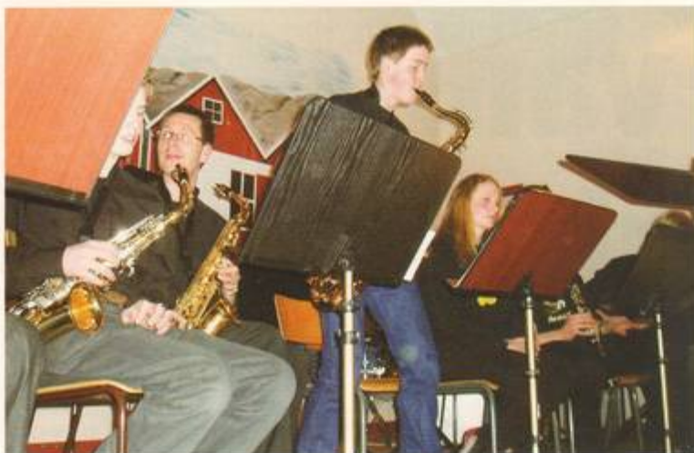
Tjörns musikskolas storband spelar till dans på Rönnängs bygdegård.

Tjörns musikskola bjöd upp till dans på Rönnängs bygdegård den 21 mars. Vårt storband och blåsorkestern NotCaparna spelade och publiken dansade. Rädda Barnen bjöd på kaffe, sålde lotter och vi hade en kanontrevlig kväll. 3 376 kr samlades in.