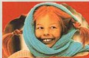
Inger Nilsson som Pippi

- Människohandel är ett problem av stor omfattning och med förödande konsekvenser för kvinnor och barn. Anna Lindh var personligt engagerad i kampen mot denna grova kränkning av människors rättigheter. Från Minnesfondens sida är vi därför glada att vi i samarbete med Riksteatern och Teater Västernorrland kommer att stimulera till debatt och opinionsbildning kring människohandel. Vi är övertygade om att teatern även på detta område kan bli ett forum för ökad medvetenhet och ett ökat engagemang, säger Ingvar Carlsson, ordförande i Anna Lindhs Minnesfond.