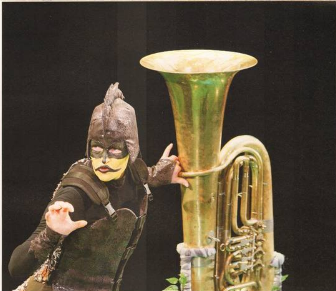
Hydran, ett av många exempel på fantasifulla kostymer i föreställningen "YOLD".

- Vi kommer på alla tänkbara sätt försöka dra nytta av den här utmärkelsen. Vi ska ta med oss det till skol- och kulturförvaltningen och till näringslivet och se vad det här kan betyda. Det här ska an-