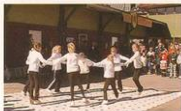
Påskdans på torget i Ödeshög.