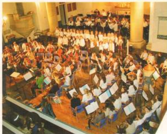
Många medverkande barn och ungdomar i Göteborg.