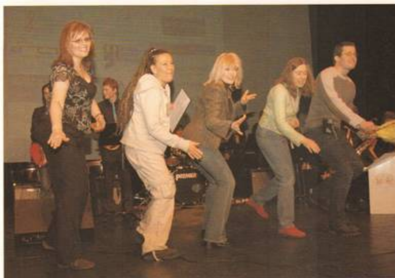
Luleå Kulturskola bjöd på tacktal i form av både sång och dans när deras projekt YOLD premiäras.

Luleå Kulturskola svarade för Årets projekt med föreställningen YOLD - ett drama från nutiden som utvecklar sig till fantasy. Projektet visar på både mångfald och skapande samarbete över åldersgränserna.