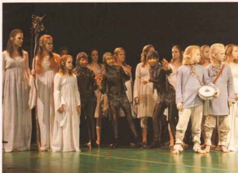
Ålver av olika slag ingick i Luleå Kulturskolas prisade projekt.