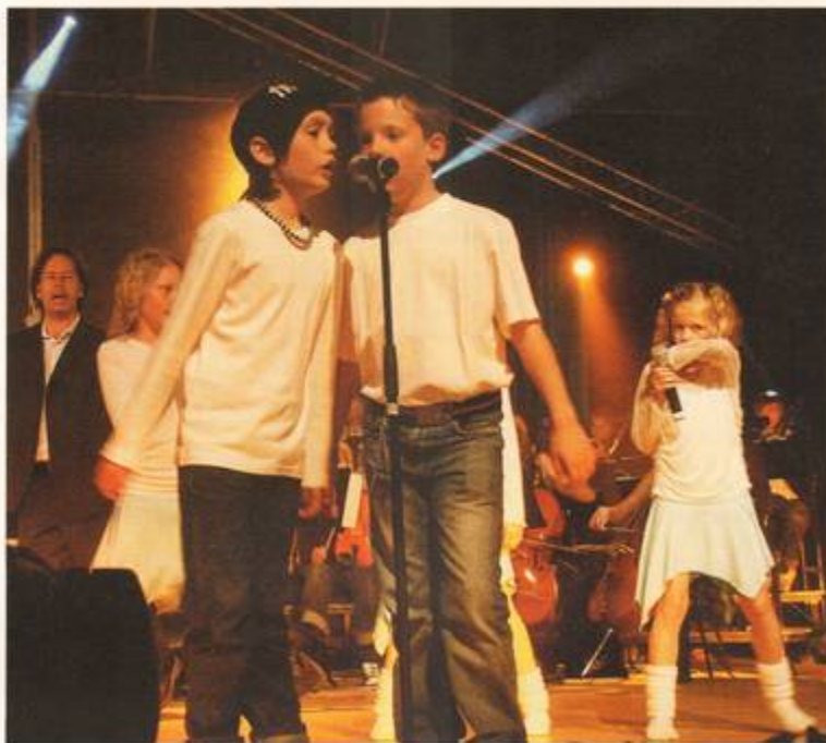
Denna duo var en av nio bidrag som gick vidare till finalen. Totalt fick man in fyrtio bidrag till festivalen.