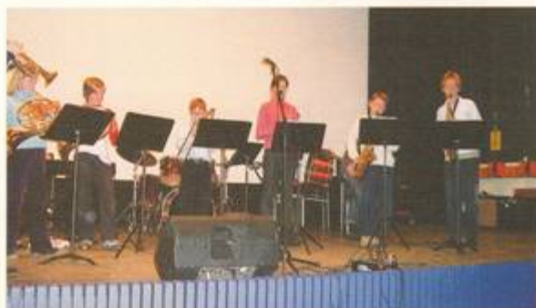
Lilla blåsorkestern Primus medverkade vid insamlingen.

Salems musik- och dansskola genomförde den 20 februari budkavlekonserten "Barn spelar för barn" i samarbete med Rädda Barnens lokalavdelning i Salem. Konserten innehöll stråkelever med solister, gitarrister och kör samt rockgrupper och blåsorkestrar. Vi samlade ihop drygt 4 700 kr.