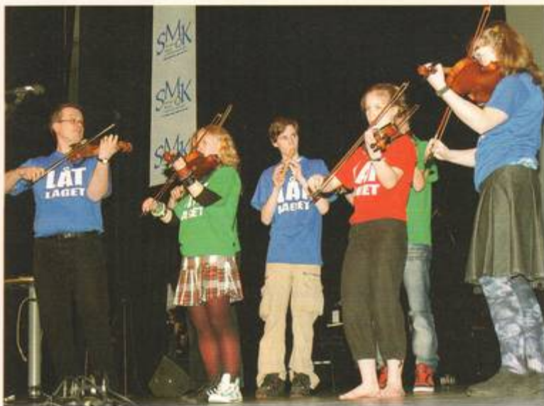
Hässleholms Musik- och Kulturskola, som 2004 utsågs till årets musik- och kulturskola, var på plats med 140 elever och lärare. Man visade upp en fantastisk bredd och bland numren fanns folk-musikgruppen Låtlaget.