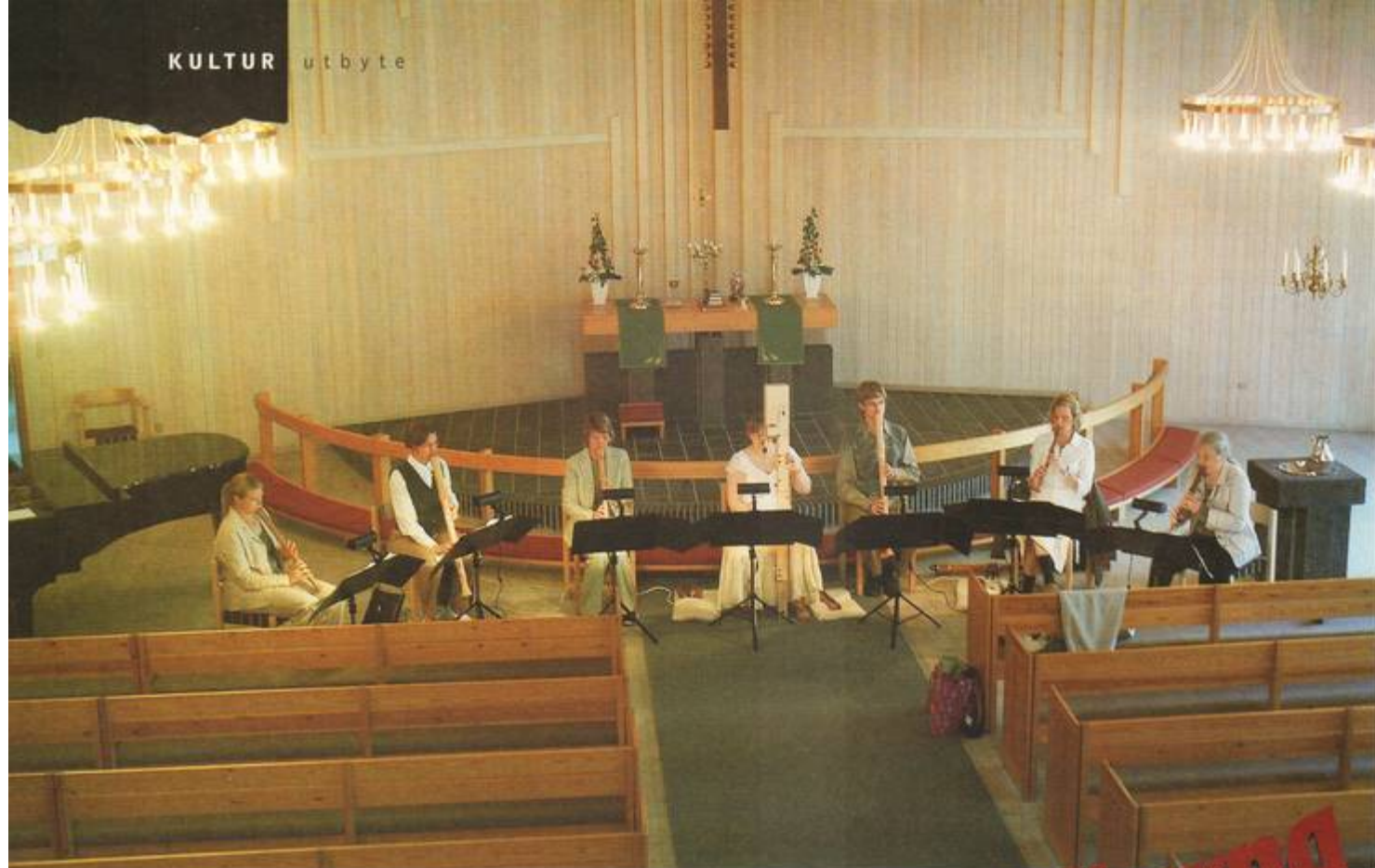
Nordanvind uppträdde bl. a. i kyrkor.