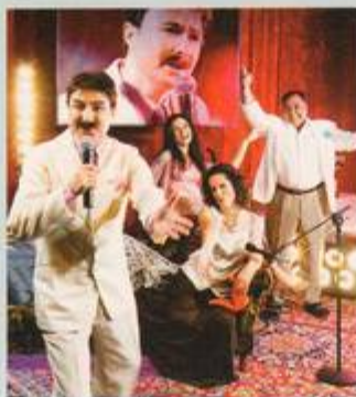
Elektra Show.