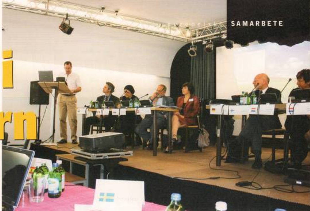
Undertecknad beskrev på generalförsamlingsmötet hur de nordiska länderna valt arbetsätt mellan de stora EMU-mötena, hur vi arbetar nätverksmässigt i en region som har mycket gemensamt internationellt sett.

Det som man samstämmigt vittnade om var en stark utveckling den senaste 15-