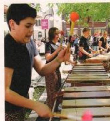
Instrumentet marimba delas beroende på storlek upp i bas-, tenor-, alt- och sopranmarimba. Här dunkar basmarimbans djupa träklang fram belä orten Kasavu från Staffanstorps i ett gungande hav på Våghustorget.

- Kommunala musikskolan är billigare och det finns ensembler och orkestrar. Och det blir väldigt dyrt att spela privat. Men man får bättre kontakt med sin lärare som privatelev. Lektionerna är längre och man hinner mer. På musikskolan blir det inte så individuellt.