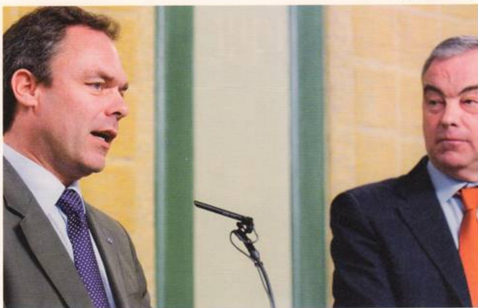
Skolminister Jan Björklund och utbildningsminister Lars Leijonborg under en presskonferens.

Svensk lärarutbildning har kritiserats och ifrågasatts från olika håll, bland annat i utvärderingar från Högskoleverket. Antalet förstahandssökande sjunker och många som börjar lärarutbildningar hoppar av. Samtidigt säger en stor del av lärarstudenterna i undersökningar att utbildningen är för slapp. Regeringen har därför tillsatt utredningen "En ny lärarutbildning" med uppdrag att föreslå förändringar.