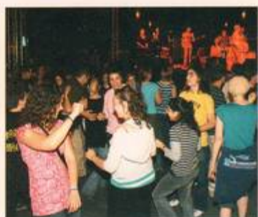
Festivalavslutningen skedde från 4 olika scener på universitetsområdet i Budapest. Vid jazzscenen blev det allmän nattdans där både ungdomar och vuxna deltog.