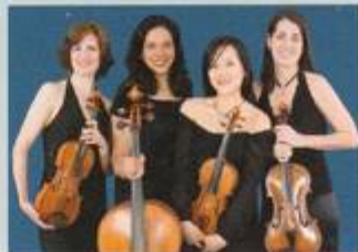
Lark String Quartet.