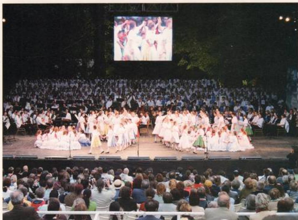
Vid invigningen av festivalen i Budapest deltog både en jättesymfoniorkester och dansare.

Den 9:e Europeiska Ungdomsmusikfestivalen hölls i Ungern i maj. Cirka 600 grupper innehållande 12 000 ungdomar var förhandsanmälda, däribland tio svenska grupper, men ungefär 9 000 elever deltog i festivalen. Gruppen Gränslöst från Falun, under ledning av Stefan Westberg, var en av de svenska grupperna.