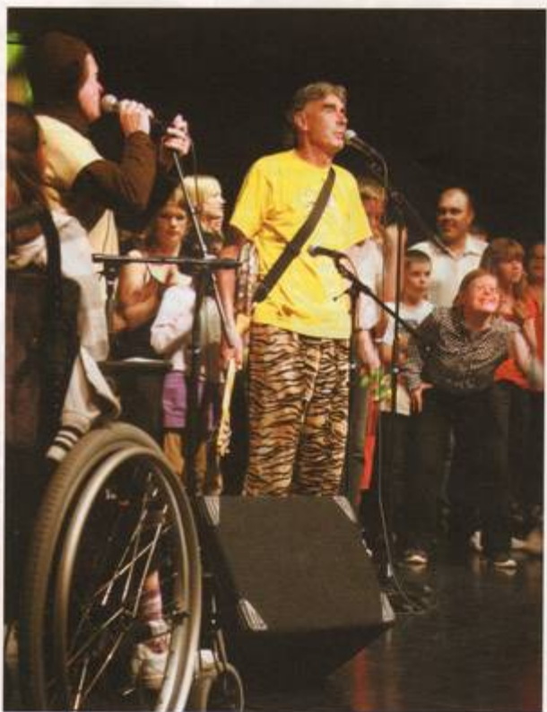
Banarne och Trazan sjunger med Pascal-deltagare i Sigtuna.