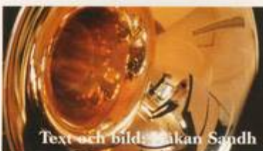
Text och bild: Hakan Sandh

Alternativt skickar du ett mail till hakan.sandh@smok.se