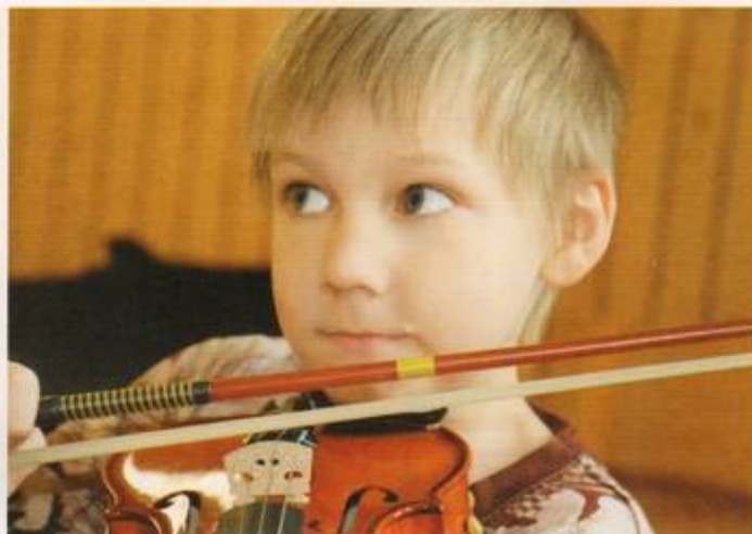
Ettorna på Vätternskolan spelar fiol på andra terminen, tjuvstartade redan i F-klassen.

jobbar vi igenom ett instrument i taget. Först spelar alla trombon, ett par veckor senare spelar alla valthorn osv. Termin 2 har alla valt instrument, får hyra det och ta hem. Då jobbar alla mot konsert i en fullsatt kyrka i samband med skolavslutningen och ett läger.