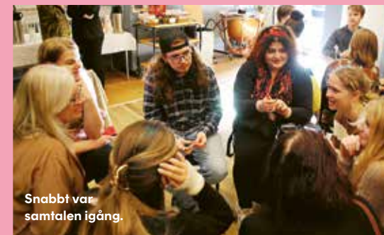
Snabbt var samtalen igång.